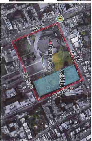
▲本基地區位與範圍